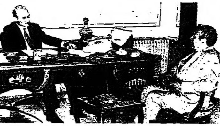
الوزير بطرس يجتمع مع السيداتوار غرة

قال وزير الخارجية السيد غزاد بطرس امس ان رئيس الحكومة الدكتور سليم الحص ابلغه نتائج مباحثاته مع القائم بالأعمال الأمريكي السيد جورج لاين ، واصفان : ان ما بلغه رئيس الحكومة لا يشكل عنصراً جديداً من شأنه ان يعدل الموقف الحاضر في جنوب لبنان . وكان الوزير بطرس قد استقبل قبل ظهر امس السيد ادوار غرة الرئيس السابق للوند اللبناني الدائم في الأمم المتحدة مع وزير الخارجية السيد غزاد بطرس بخفايا في الأمم المتحدة خلال دورتها الحالية . كما استقبل بطرس بعد ذلك بعض ضباط وزارة الدفاع الذين بحث معهم عدة امور ادارية تتعلق بالوزارة .